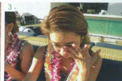
1: ハワイのリラックスモードの中でもしっかりとヨガを学べ、深めることができるのが、当校の特徴。先生達の指導はハンパない！ 2: 一期一会の言葉を丁寧に拾っていくことで、今後のヨガ人生が豊かになっていくはず。3: 仲間達との夢中な日々はあっという間に終わってしまう。でも、みんなすがすがしい笑顔で卒業！